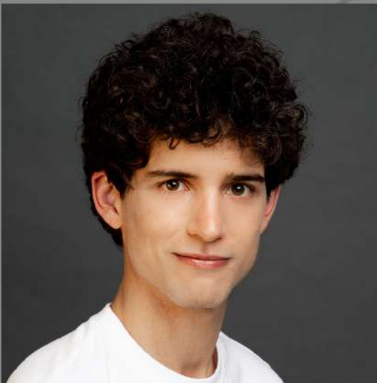
JUAN DE VERA